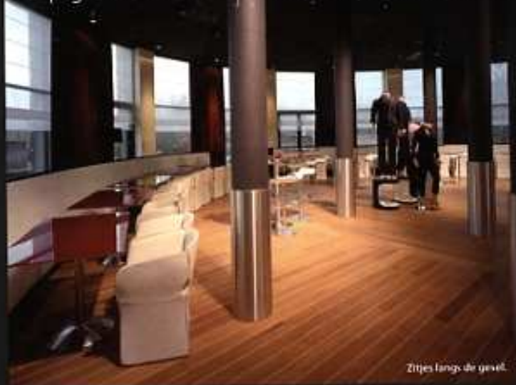
Zitjes langs de gevel.