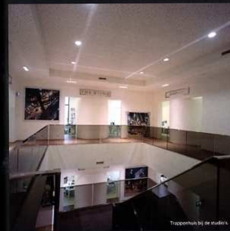
Trappenhuis bij de studio's