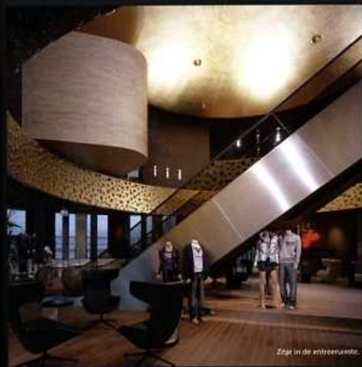
Zige in de entree ruimte.

Modeketen The Sting is opgericht in 1982; het eerste filiaal werd geopend in Tilburg, waar ook het hoofdkantoor is. Momenteel heeft The Sting ruim 70 winkels in Nederland. In Lijnden worden de 30 merken van de keten ontworpen en ingekocht. Ook komen de filiaalmanagers hier om de collecties te bekijken. Waar dit in de vorige behuizing (het World Fashion Centre in Amsterdam) verspreid over verschillende ruimtes moest gebeuren, kunnen in het nieuwe gebouw grote groepen tegelijkertijd worden ontvangen. Er is ruimte voor circa 50 medewerkers, maar het gebouw is berekend op toekomstige groei.